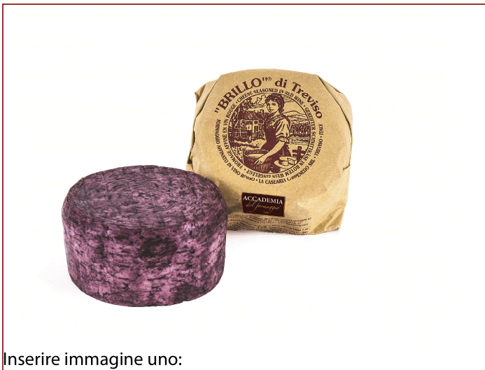
Inserire immagine uno:

*il prodotto riporta le seguenti scadenze: 13/03/23 - 16/03/23 - 05/04/23 - 09/04/23 - 12/04/23 - 13/04/23